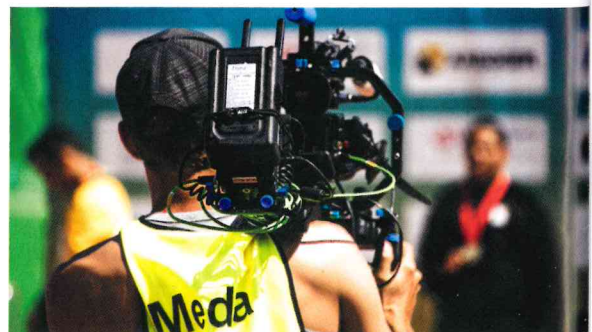
Mobile Kamera an der Para-Junioren-WM 2019 in Nottwil.

Connectivity: Am gewünschten Standort eine stabile und mit genügend Bandbreite ausgestattete Internetverbindung herzustellen ist zentral für die Echtzeit-Datenverarbeitung. Upstream